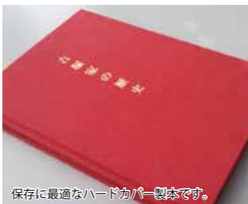
保存に最適なハードカバー製本です。