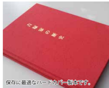
保存に最適なハードカバー製本です。