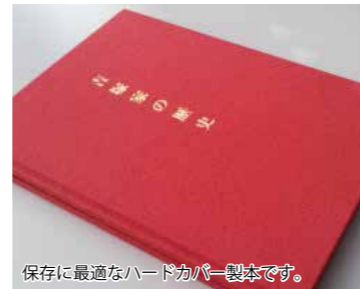
保存に最適なハードカバー製本です。

※料金は、調査項目や調査日数、報告書のページ数によって変わります。 調査の過程で出てきた資料も含め、PDFデータでもお渡し可能です。