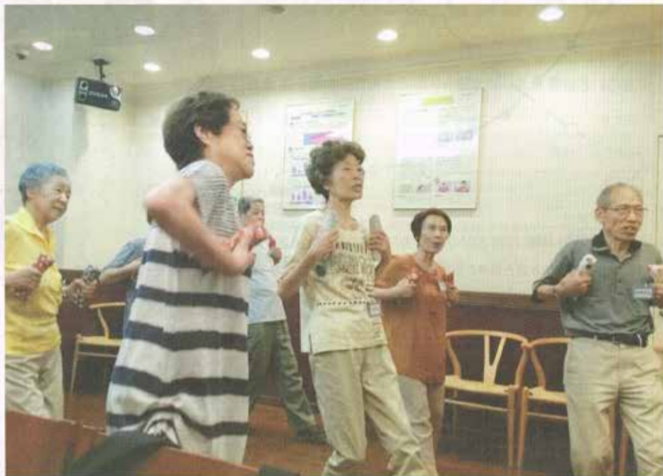
▲友人や知人たちと一緒に楽しみながら気軽に運動

核家族化が進む中、高齢者が高齢者の介護をする「老老介護」や、認知症高齢者が認知症高齢者を介護する「認老介護」が社会問題化している。入浴、移乗、食事、排泄など肉体的にも負担の大きい介助は、介護施設で働く若い職員ですら重労働で、腰痛などを患うケースも多い。家族ができるだけ長く幸せに暮らすために、老老介護問題の現状と対策について考える。(特集記事1〜3面)